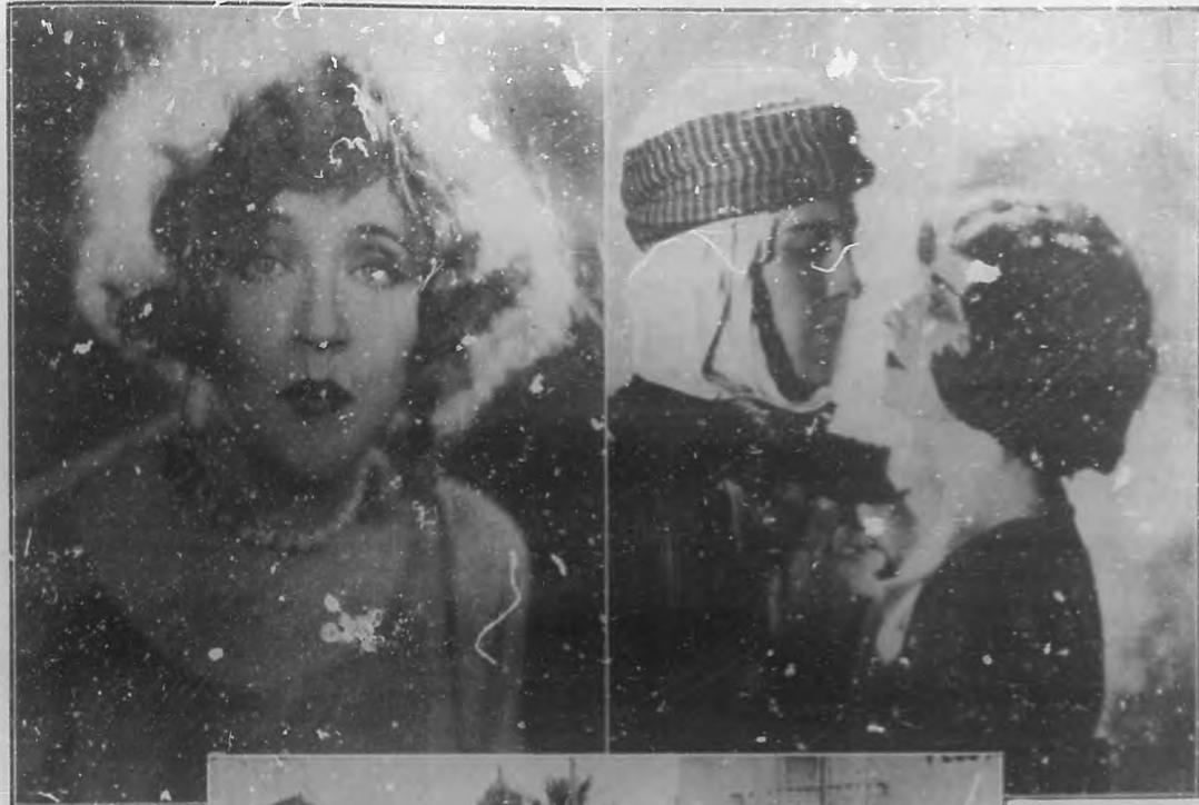
Alicia Terry y Ramón Navarro en "El Árabe"

En medio de aquella campal, una chiquilla beduina de diez años de edad, Zina de nombre, atravesó por entre las esteras para traer a Alicia Terry una camasta de huevos, que estuvo a punto de estrellar sobre el ruizante pecho de Ramón Navarro.