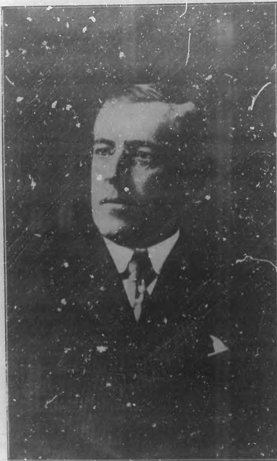
MR. WOODROW WILSON

Quizás he divagado un poco y los lectores que hayan empezado a leer el presente artículo lo crean separado del epígrafe, pero la fantasía humana es mayor de lo que parece, cuando se tiene la mente y el pensamiento fijos sobre una cosa se vuelan en alas de éste, y es lo que me ha sucedido al separarme del cuerpo principal del artículo.