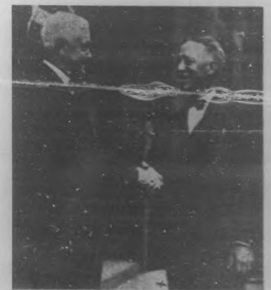
"Al" Smith, gobernador del Estado de New York felicita al candidato a la Presidencia por el partido democrático, John W. Davis.

New Jersey y tuve que volver inmediatamente, porque no podía soportar la tristeza de estar lejos de Broadway.